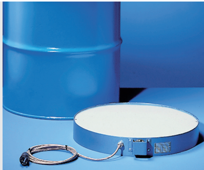
Réchauffeur sol BO-200 et BO-200/EX