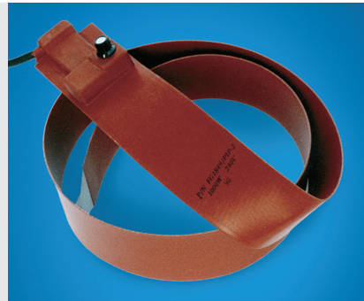
Ceinture chauffante BH-200