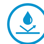
건물 및 부식 방지