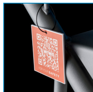
QR 코드를 통한 안전 수칙