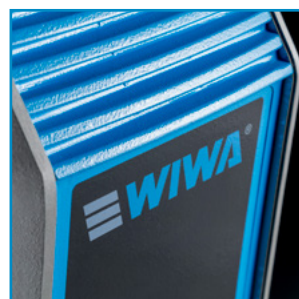
현대적이고 간결한 표면