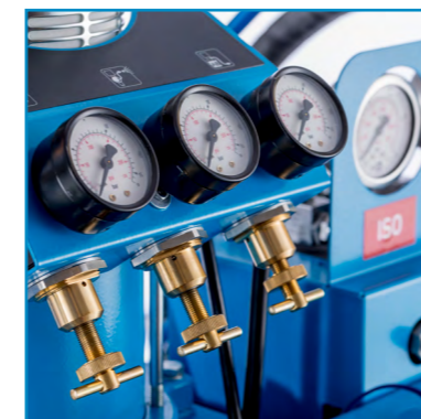
Controle fácil de usar