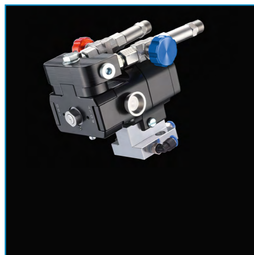
WIWA PU GUN 4040 pistola automática

Com o desenvolvimento do WIWA PU GUN 4040 , estamos a expandir a nossa vasta gama de tecnologia inovadora de aplicação de PU com a nossa própria pistola de pulverização.