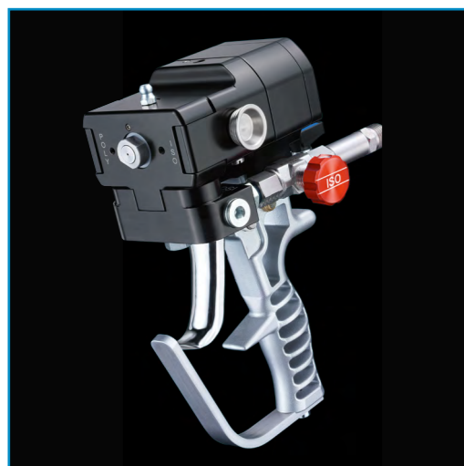
WIWA PU GUN 4040 pistola manual