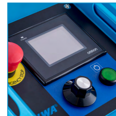
Interface inovadora com fácil operação