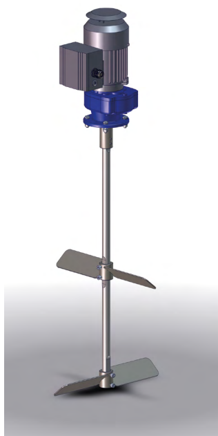
Agitateur pour fût de 216,5 l N° de cde 0666355