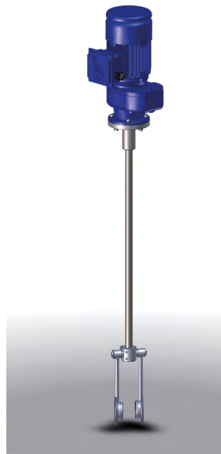
Мешалка для 1000 л контейнера (еврокуба) Номер для заказа 0663027