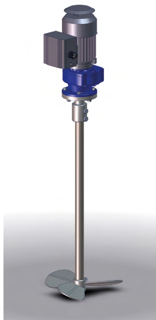
Мешалка для 216,5 л бочки Номер для заказа 0661873