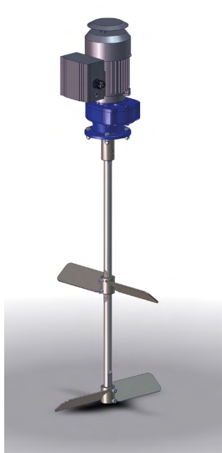
Мешалка для 216,5 л бочки Номер для заказа 0666355

** Зона АTEX 1 соответствует категории взрывобезопасности II2GcIIBT3